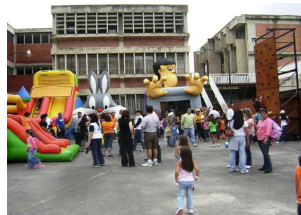
La Familia Concepcionista celebró en grande

Las actividades planificadas han comprendido los tradicionales juegos intercurso, donde los más chiquiticos de la casa han compartido espacios hasta con los padres y representantes en